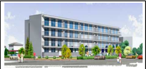
第一次福島県復興公営住宅整備計画