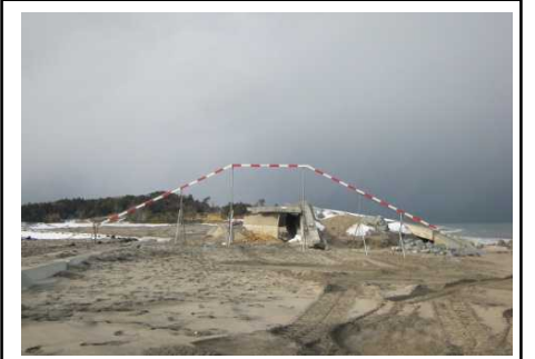
木崎海岸(相馬郡新地町)