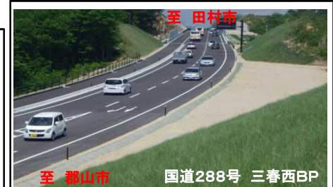
至 郡山市 国道288号 三春西BP