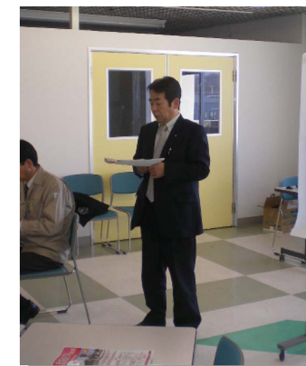
白河市 都市計画課長

本年度の懇談会のまとめと参加者の方々に懇談会の感想を述べていただきました。また、『わたしの白河ガイドブック』の配布予定の説明がありました。