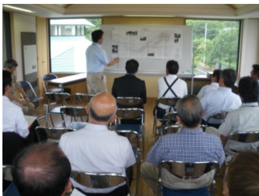
写真：説明会の様子