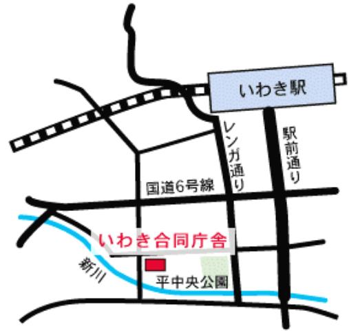
第5回 県いわき合同庁舎