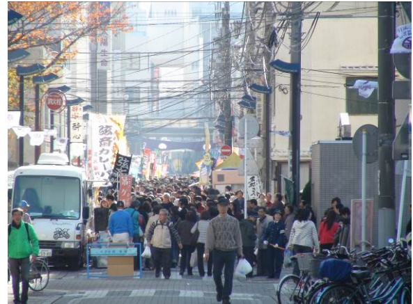
第2回かながわ朝市サミット（平塚） 97店が出店、約30,000名が来場