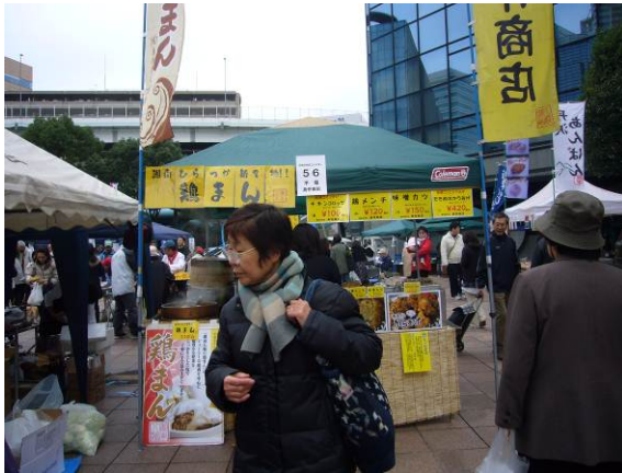
第1回かながわ朝市サミット（横浜） 57店が出店、約6,000名の来場者

今回は第3回目として小田原での実施を企画しました。つきましては、趣旨に賛同され、出店していただきますようご案内申し上げます。