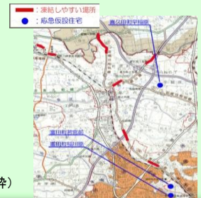
ヒヤットマップ(一部抜粋)