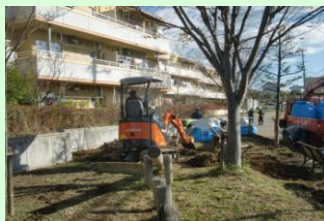
除染中の柴宮団地