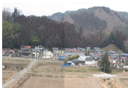
9 樋ノ口 急傾斜地対策