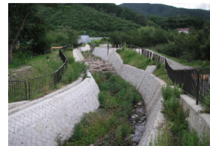
8 くるみ沢 通常砂防