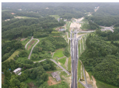
1 あぶくま高原道路 (石川母畑ICから平田西IC方面)