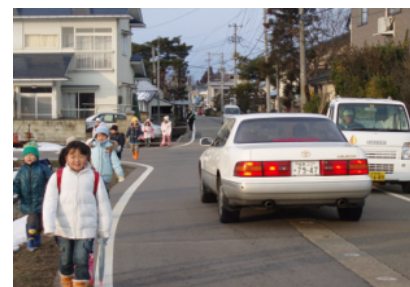
7 浜崎高野会津若松線(笈川) 歩道整備