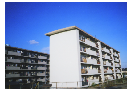
12 県営住宅 梅ヶ丘団地 住宅リフォーム