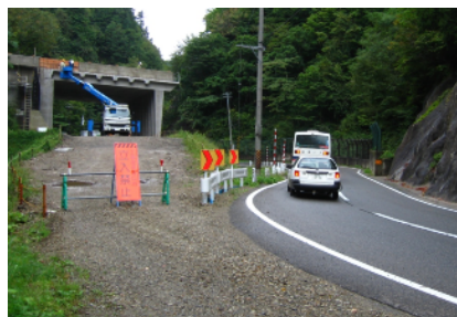
6 国道352号(八総バイパス)