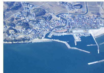
11 大戸浜(釣師浜漁港・海岸)