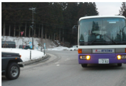
5 国道459号(三ツ屋) 交差点改良