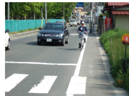
4 国道349号(川原田) 歩道設備