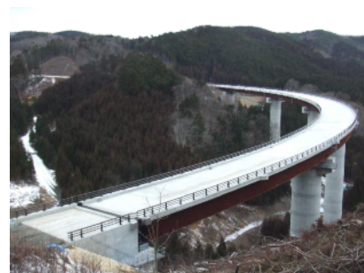
3 国道289号(荷路夫バイパス)