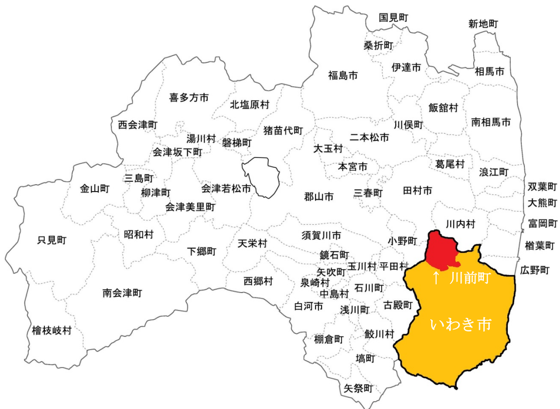
図 1 いわき市川前町の位置

いわき市は、福島県の東南端に位置し、茨城県と境を接する広大な面積を持つまちです。東は太平洋に面しているため、寒暖の差が比較的少なく、温暖な気候に恵まれた地域となっています。地形は、西方の阿武隈高地（標高 500~700m）から東方へゆるやかに低くなり、平坦地を形成し、夏井川や鮫川を中心とした河川が市域を貫流し、太平洋に注いでいます。