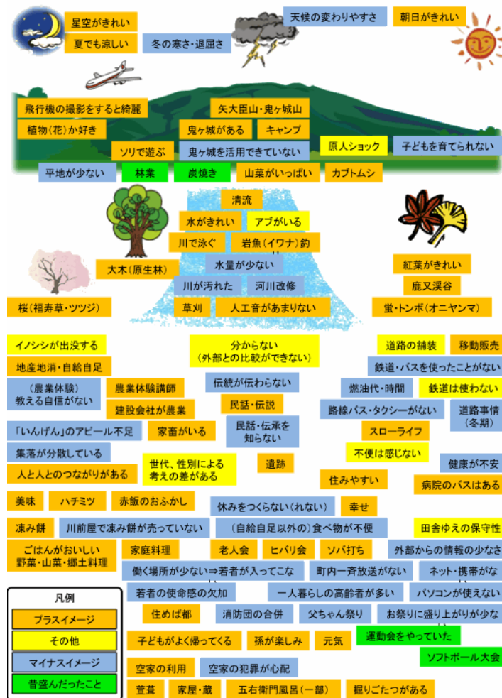
図 4 高部集落の意見・キーワード