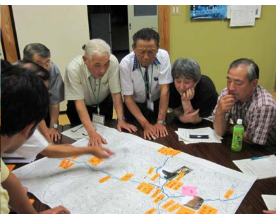
写真4 ひまわり会議の様子2