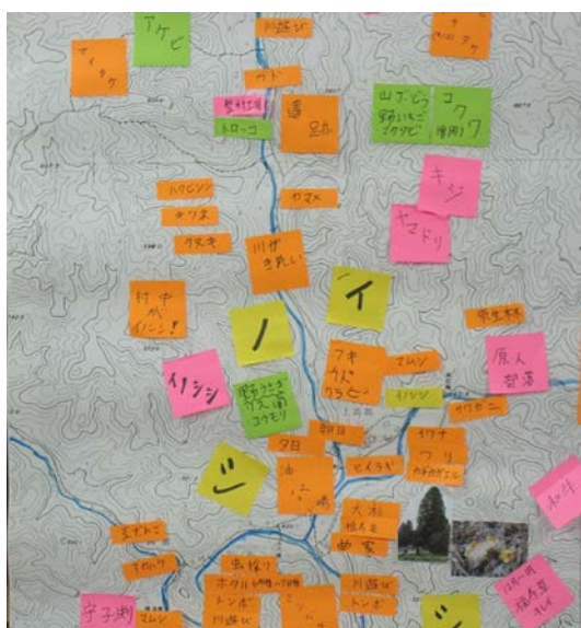
写真5 A班のいいところマップ