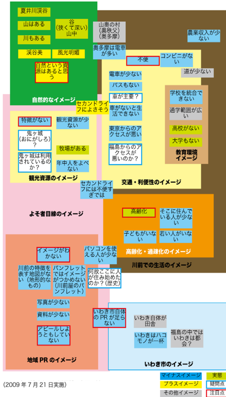
図3 いわき市川前町第9区調査前の学生の持つイメージ

高部に行く前に、高木先生の指導のもと事前ワークショップを行いました。KJ法※を用いて、高部に対する事前イメージをまとめていきました。