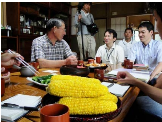
写真2 聞き取り調査の様子2