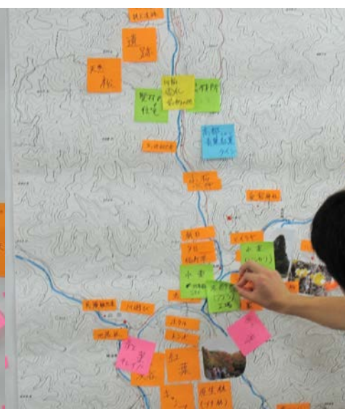
写真6 B班のいいところマップ