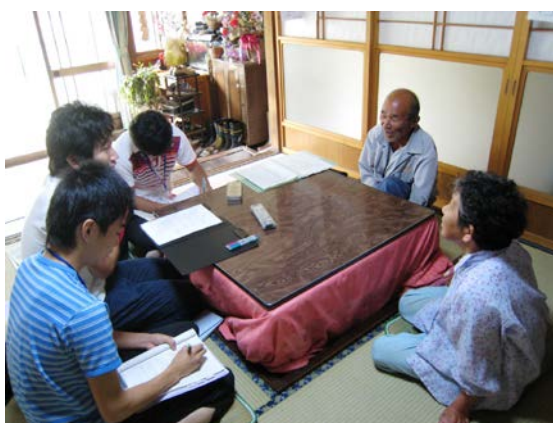
写真1 聞き取り調査の様子1