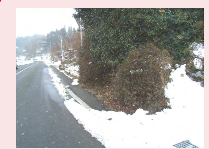
・草がのびていて歩道がせまくて歩きにくい