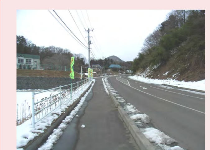
・凍って危ない ・通学路がほとんど凍っていて気をつけて歩かなければならぬ(わざわざ凍っていない所を見つければならぬ) ・凍って歩きにくい!!