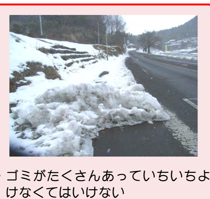
・ゴミがたくさんあっていちいちよけなくてはいけない