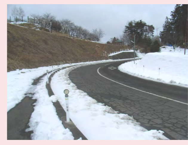
・急なまがりカーブで木が大きいから氷がとけず車がマンホールの上ののって車がマンホールからはずれなくなる!