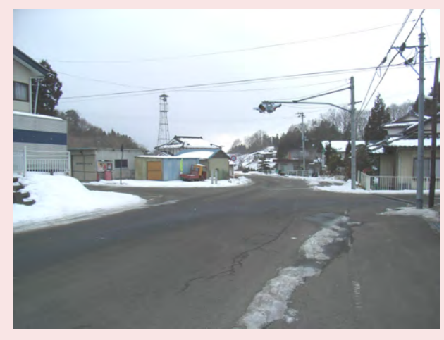
・横断歩道がない ・一時停止信号があるのに、止まらない車が多い!