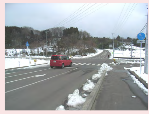
・信号がなくて車が止まらない。危険 ・交差点で一時停止しない車があって危険。人も車も! ・車道の「止まれ」のかんばんが小さくて見づらい