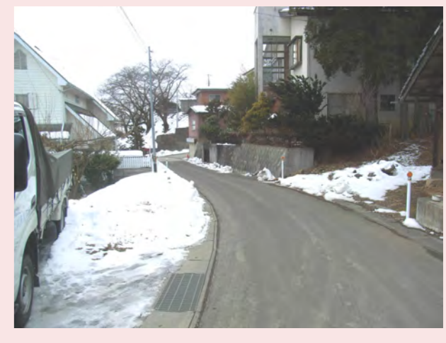
・道路が細くて、車の1台が少しもどっていかないと通れなくて車1台とはじの方に人が1人くらいしか通れない! ・急な坂道なので歩くのがとても大変!