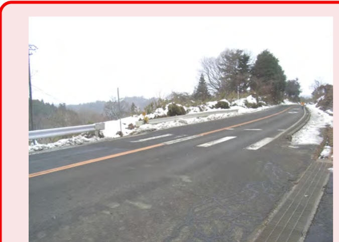
・車が多くてわたれない!