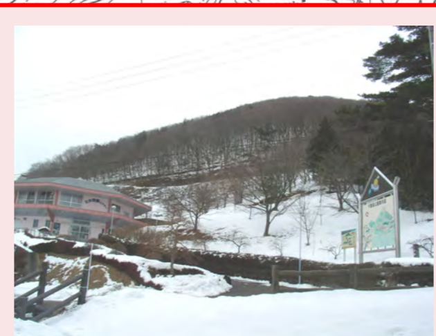
・千貫森公園は、青木地区で数少ない公園の1つなので楽しく遊ぶために除染してほしい ・千貫森は青木のシンボルなのでまた除染をして、元の楽しい千貫森公園にしてほしい。遊具はグチャグチャです。これでは楽しいお祭りができません。なおしてほしい!