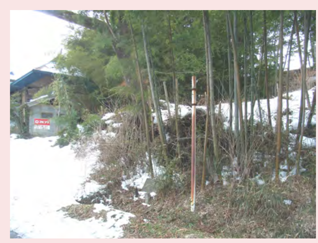
・ミラーが見えない