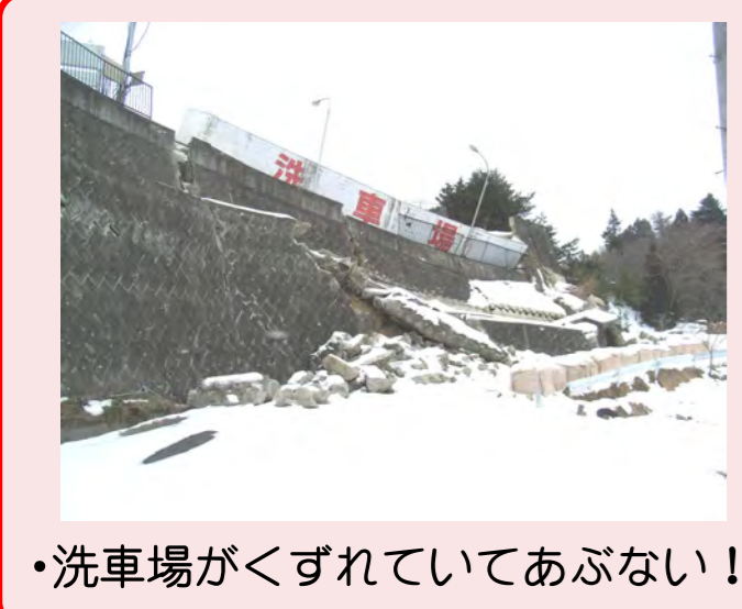
・洗車場がぐずれていてあぶない!