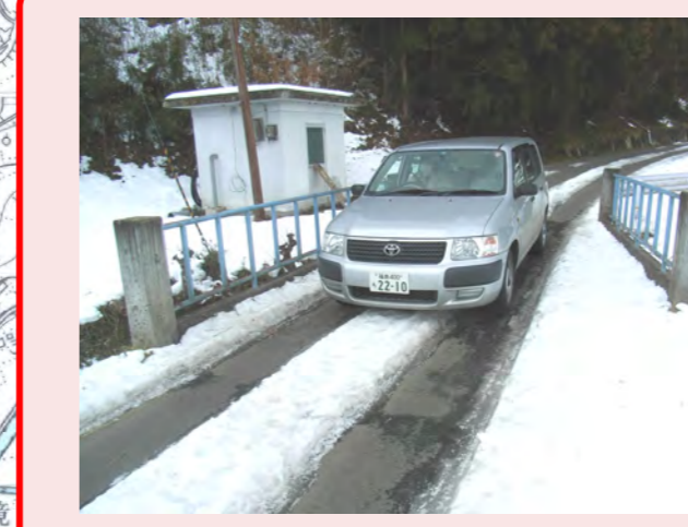
・道がせまくて、車がきたら危ない ・橋がこわい!! ・危ない橋を広くなおしてほしい