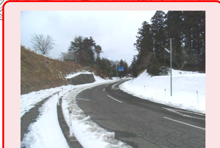
・木がたくさんあって凍って(とけなくて)歩きづらい!