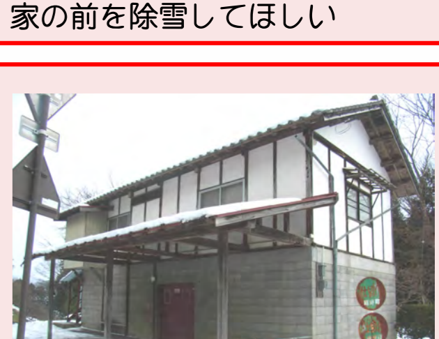
・家の前を除雪してほしい