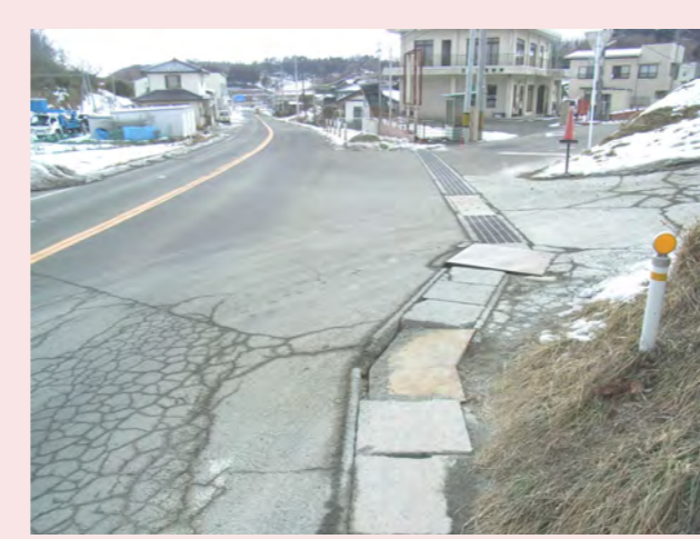
・トラックがきて危ない!