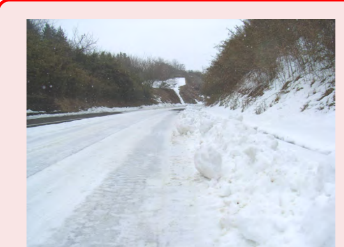
・除雪車が通ると歩道がふさがれる ・歩道がせまいのに除雪されてるし日かけて解けなくて歩道は雪が深い道路が凍ってるのが大変。道の真ん中近くを歩いている!