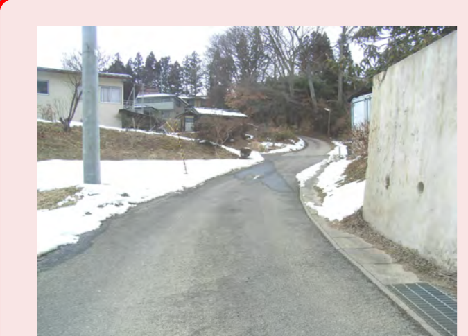
・急な下りざが氷の張ってる日すべて大変!氷のない日も直す方法はないと思うだから、自分で考えてやる ・道がせまい ・トラックが来ると歩くのが大変 ・もうちょっと道を広く歩道を作してほしい