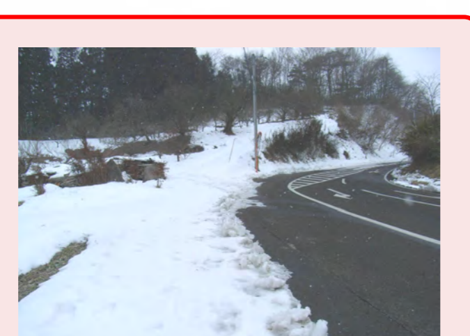
・上ってきゅうな下りになるので車があぶない ・とばす車が多い