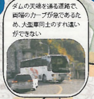
ダムの上を通る道路で、両端のカーブが急であるため、大型車両のすれ違いができない