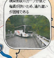
橋梁直前のカーブが急で幅員が狭いため、すれ違いが困難である