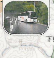
カーブ内の幅員が狭く、すれ違いが困難である