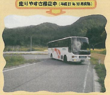
大型バスとは、総長12m、幅2.5m、高さ3.8m、ホイールベースが6.5m程度のものを使います。

会津地域は、国道289号甲子道路、国道400号田島バイパスの開通等により、観光客の増加が見込まれております。会津地域の山間部は「道路が狭い」「カーブが多い」など、大型の観光バスが走りにくいという先入観があるようです。そこで、会津地域の主要幹線道路で、実際に大型バスを使い、走りやすさを検証し、バスの運転手さんの意見を聞きながら、「大型バス走りやすさマップ」を作成しました。 今後、当マップを利用する皆様からご意見を頂き、会津を訪れる方々に、より使いやすいものにしていきたいと考えております。ご意見ご感想をお寄せ下さい。