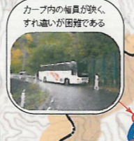
カーブ内の幅員が狭く、すれ違いが困難である