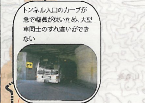
トンネル入口のカーブが急で幅員が狭いため、大型車両のすれ違いができない