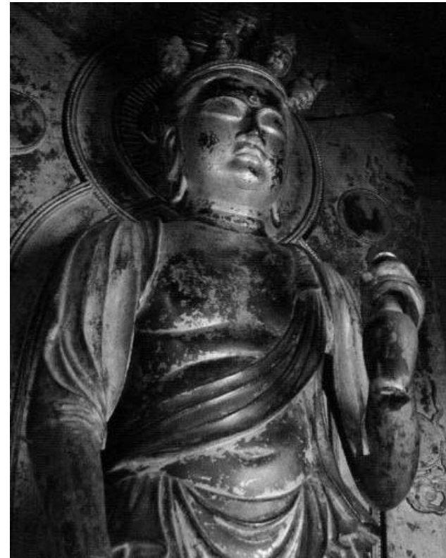
銅造十一面觀音像（弘安寺）