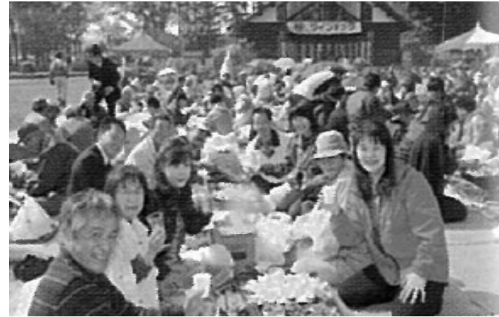
新鶴温泉ワイン祭り