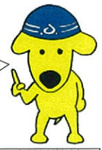
あぶくま町村交差点 マスコット とうろく君

あぶくま地域は、災害に強く、強固な地盤を持ち、東北自動車道、磐越自動車道を結ぶ「あぶくま高原道路」などの便利な高速交通網を持った良好な立地条件の工業団地が数多く存在しています。関東圏からも近く、福島空港へのアクセスも便利です。「あぶくま高原道路」の整備により「福島空港」から1時間で行けるエリアが広がり、大きなビジネスチャンスとなります。現在、平成22年度の全線開通を目指し鋭意施工中です。