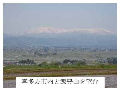
喜多方市内と飯豊山を望む