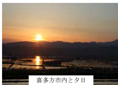
喜多方市内と夕日