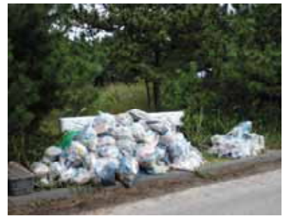
平成21年度の活動状況