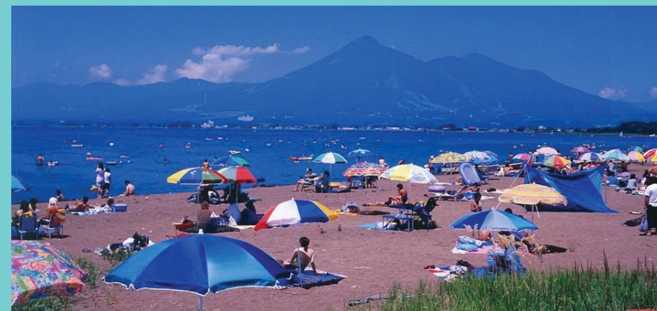
猪苗代湖から磐梯山を望む