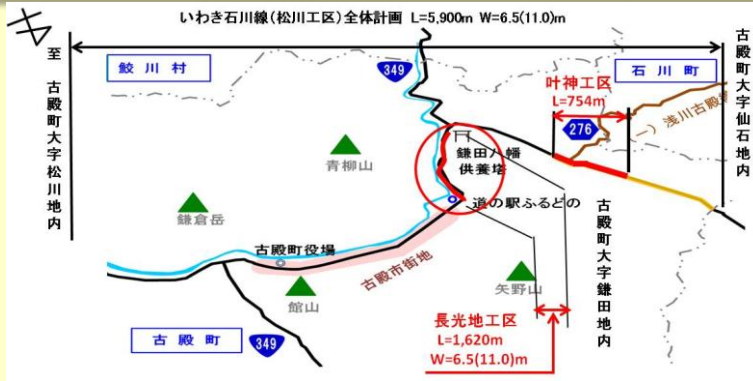
【長光地工区 現道状況】

長光地工区(延長1.6km)及び叶神工区(延長約0.8m)は、当路線の中でも特に道路幅員が狭く、急カーブが連続する区間であることから線形改良するものであり、この整備により、安全で円滑な交通を確保するとともに、さらなる物流の効率化を図ります。県では、昨年度新規着手した長光地工区、叶神工区の整備を推進するため、本年度より用地買収を開始します。