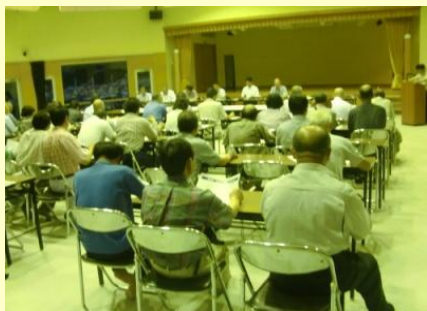
(田村市天地人大学、7月29日)