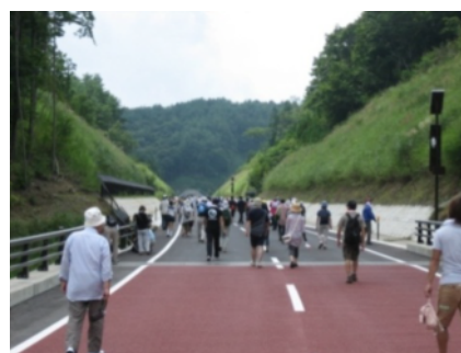
8/29 開催 ウォーキングイベント状況

この地域は、豊かな自然が残され、多様な動植物が生息していることから、生き物や自然環境を大切にする「エコロード」として整備を進めてまいりました。