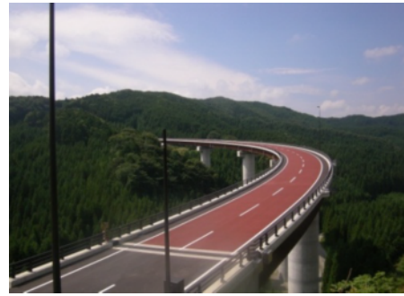
かいどまり 貝泊大橋

荷路夫バイパスの開通により、いわきと県南地域、更には南会津地域の交通の利便性・安全性が向上し、観光や文化など幅広い分野で交流が深まります。また、物流がより活発になるとともに、医療や福祉においても地域の方々をしっかりと支えます。