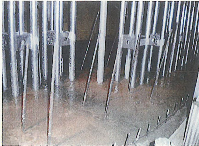
コンクリート打設状況