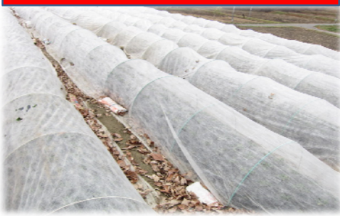
原発事故時に使用していた べたがけ資材