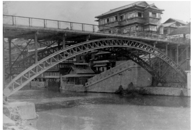
架設当時の十綱橋